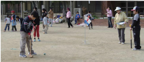
「PTAオータムフェスタ 2008」のグラウンドゴルフ