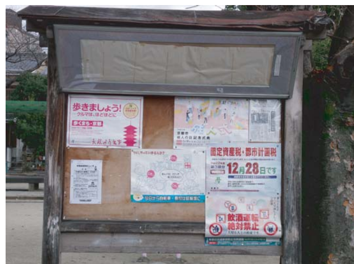
▲地域に設置された掲示板

地域間の特性を理解するうえでも、隣接する地域間のこのような情報について、日常的に交換し、地域の広報誌などに相互に発信することが必要です。